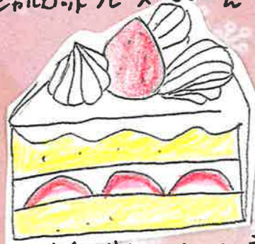
イチゴ-ショート 280円