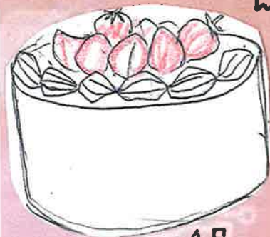
イチゴ-ショート 4号 700円