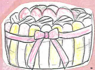
シヨロ-ットフレス 650円