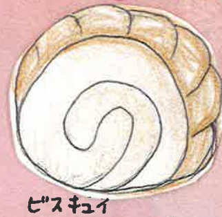
ビスキュイ シヨコラ-ル 200円